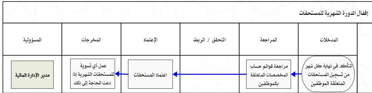
شكل رقم / ٥

يوضح المخطط البياني التالي ( شكل رقم/٥) طريقة تسلسل العمل لإقفال الدورة الشهرية للمستحقات: